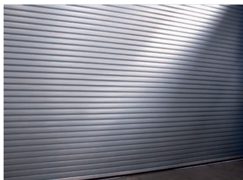
Tablier Isolé galvanisé vernis