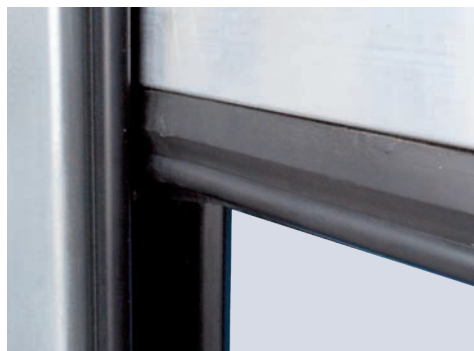
Coulisse en acier galvanisé avec patins de glissement, lame finale avec joint