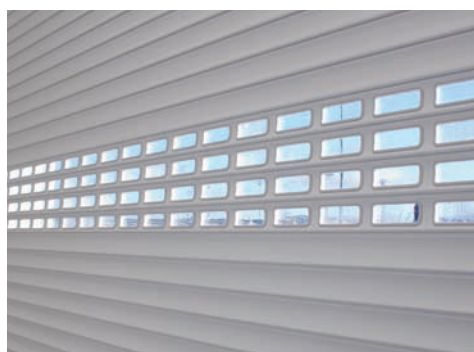
Tablier Isolé avec rangées de hublots