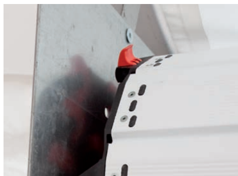
Tablier Isolé avec embouts "Grand vent"

Le rideau Murax isolé est conçu pour protéger votre local tout en apportant une isolation thermique et phonique. Avec ses réservations réduites, il est une alternative aux portes sectionnelles.