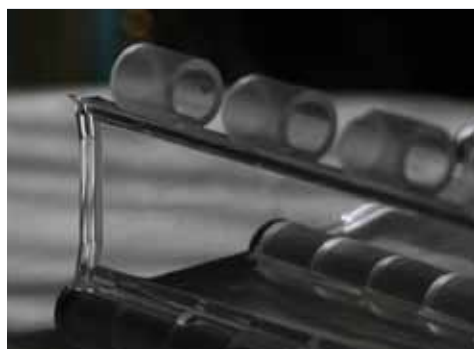
Maillons en PCP (Polymère Composite Personnalisé)