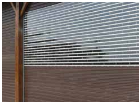
Mixage Murax Vision et Murax 110 Laqué marron